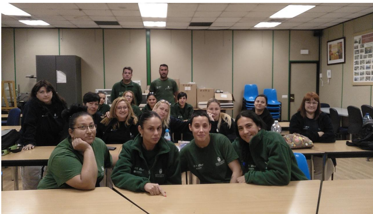
Personas con cargas familiares en periodo de formación y cualificación profesional