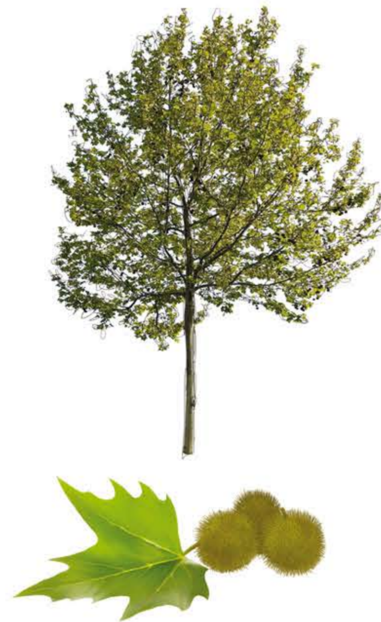
Plàtan d'ombra Platanus x hispanica

Port: trepadora molt robusta. Tronc: tiges llenyoses, quadrangulars i volubles. Fulles: compostes de 5-11 folíols dentats lanceolat-ovats, de color verd fosc, la base cuneada, a sovint un poc asimètrica i l'apex curt o llargament acuminat. Flors: estiu-tardor, grans i molt vistoses, acampanades de color rosa amb nervació violàcia, disposades en panícules amples, terminals i aromàtiques. Fruits: càpsula linear amb llavors alades, que rara vegada apareixen.