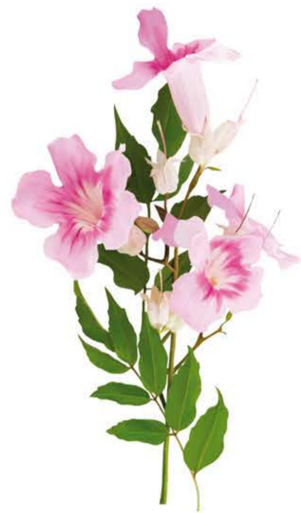
Bignonia rosada Podranea ricasoliana

Port: trepadora molt robusta. Tronc: tiges llenyoses, quadrangulars i volubles. Fulles: compostes de 5-11 folíols dentats lanceolat-ovats, de color verd fosc, la base cuneada, a sovint un poc asimètrica i l'apex curt o llargament acuminat. Flors: estiu-tardor, grans i molt vistoses, acampanades de color rosa amb nervació violàcia, disposades en panícules amples, terminals i aromàtiques. Fruits: càpsula linear amb llavors alades, que rara vegada apareixen.