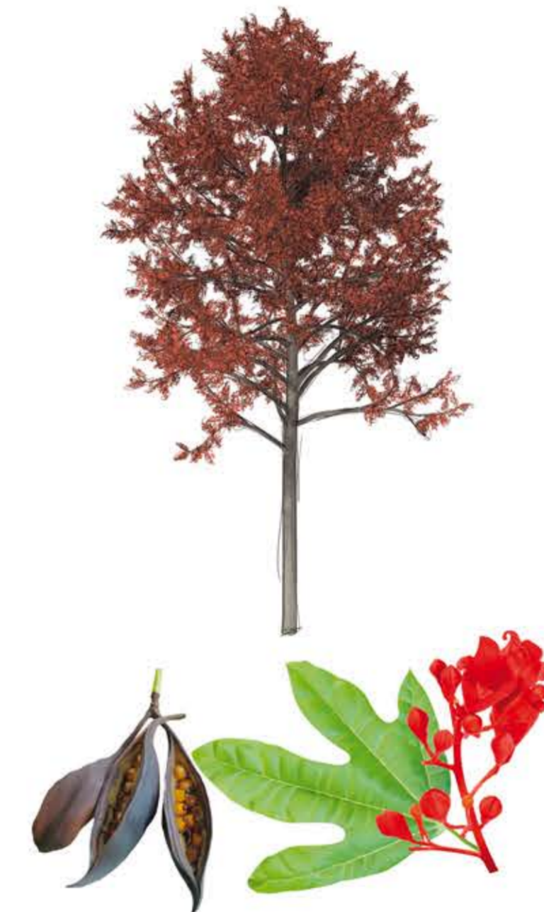
Arbre del foc Brachychiton acerifolius

Port: arbre semiperennifoli, de 10-35 m d'altura, copa semiovoïdal de 4-10 m d'ample. Tronc: engruixit, que emmagatzema aigua. Escorça llisa, de color gris fosc. Fulles: simples, lobulades de jove i romboïdals, paregudes a les del xop. Anvers verd fosc brillant i revers més clar. Flors: abril-juliol. Acampanades, agrupades en panícules, blanc crema a l'exterior i taques roges a l'interior. Fruits: principi de la tardor. Fol·licles de color negre amb llavors grogues recobertes de pèls irritants al tacte.