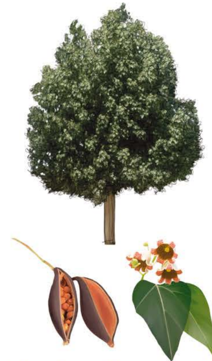
Arbre botella Brachychiton populneus

Port: arbre perennifoli, de 18-35 m d'altura, 8-15 m d'ample, de capçada cònica. Tronc: escorça clivellada o solcada, de color gris. Fulles: compostes, pinnades o bipinnades, sedoses, amb pinnes de color verd clar brillant per l'anvers i verd argentat pel revers. Flors: abril-juny, grogues o ataronjades, menudes, disposades en rams erectes en forma de raspall. Fruits: fol·licles coriàcis de color marró fosc, que maduren a la tardor.