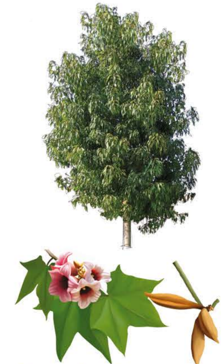
Braquiquiton rosa Brachychiton discolor

Port: arbre semiperennifoli (perd la fulla abans de florir), de 10-35 m d'altura, de copa semiovoïdal, de 4-10 m d'ample. Tronc: engruixit. Escorça llisa, verd grisenc que evoluciona a gris clar. Fulles: simples, palmades, grans, amb l'anvers i el revers verd. Flors: juliol-agost. Acampanades, de color roig viu, agrupades en panícules. Fruits: fol·licles negres. Les llavors de color groc tenen pèls irritants al tacte. Apareixen al principi de la tardor.