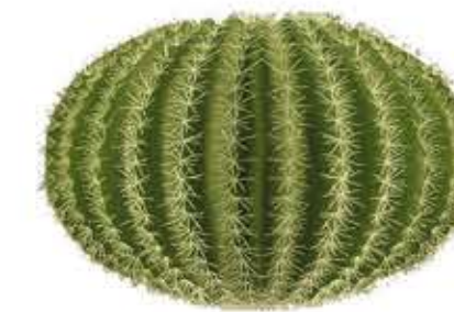
Seient de sogra Echinocactus grusonii

Agavàcia que no forma tija. Fulles: formen rosetes de 20–30 fulles. Cadascuna d'elles és d'1 m de llarg i 35 cm d'ample. Espines: en el marge, de 3 cm, negres en forma de ganxo, i a l'extrem una espina més llarga. Flor: Inflorescència fins a 10 m d'alt i, com tots els agaves, una vegada acaba la floració comença a morir.