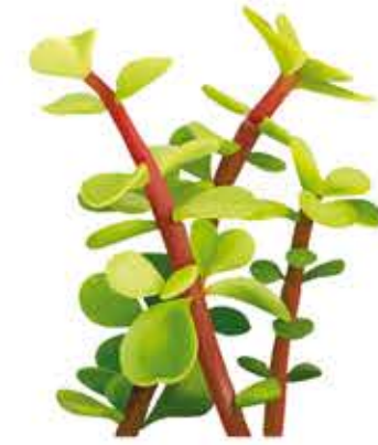
Planta dels elefants Portulacaria afra

Arbust suculent de 0,6–1 m d'alt. Tiges: verdes erectes, poc ramificades amb denses rosetes grans. Fulles: en forma d'espàtula, acuminades, verd brillant, ocasionalment amb algun tint purpuri prop de l'apex. Davant l'exposició al sol es tornen de color entre violaci i rogenc. Flors: d'hivern a primavera, agrupades en espigues de color groc intens. Després de la floració, la roseta es seca, i en algunes varietats la planta mor. Les varietats 'atropurpurea' i 'Schwarzkopf' de fullatge púrpura obscur.