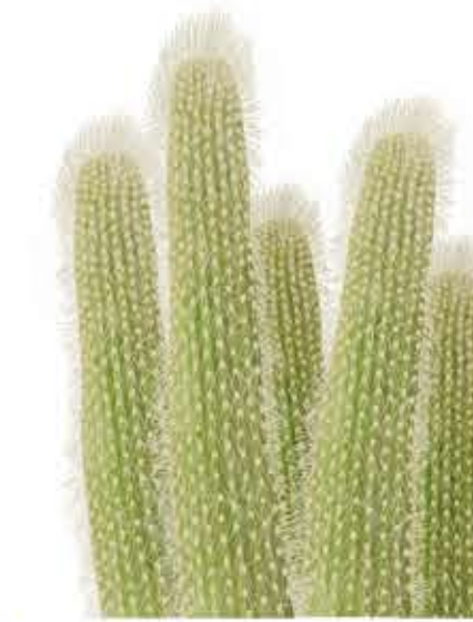
Cleistocacte Cleistocactus strausii

Cactus arborescent o arbust molt ramificat, fins als 5 m. De color gris verdós. Tiges: erectes amb 5–8 costelles. Espines: de les arèoles ix una espina central llarga i altres radials més menudes. Flors: principis d'estiu. Xicotetes en sanglots de color blanc, crema o verdós, pol·linitzades per abelles, papallones nocturnes i rates penades. Fruits: xicotets de color violaci, púrpura o roig.