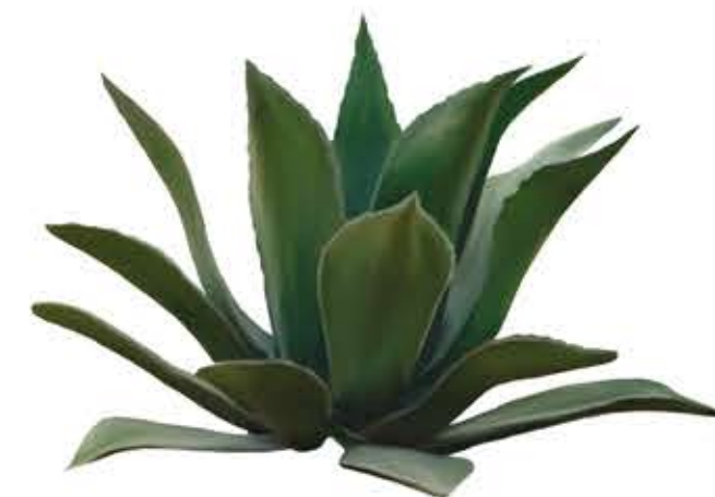
Atzavara de muntanya Agave salmiana var ferox

Planta crasa arbòria que pot arribar a 12–20 m d'altura. Tronc: simple que forma braços molt ramificats de 4 angles amb espines. Les branques arriben a fer uns 3 m formant una copa ampla i arrodonida. Flors: en grups, són grogues broten a l'extrem de les tiges en primavera. Igual que la resta d'espècies del gènere, és una planta tòxica perquè la seua saba interior pot causar picor i irritació.