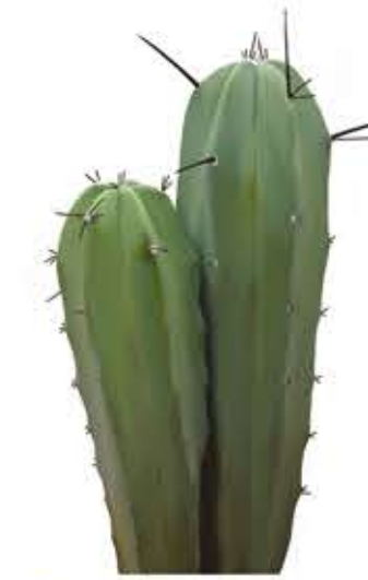
Mirtillocacte Myrtillocactus geometrizans

Planta crasa o suculenta que sol fer uns 2,5–4 m d'altura. Tiges i branques cilíndriques que es fan llenyoses al madurar. Fulles: menudes, ovalades o arrodonides, tendres i sucoses. Flors: fi de la primavera. Xicotetes, rosades o blanquinoses agrupades en plomalls.