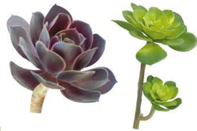
Aeòniom Aeonium arboreum

Arbust suculent de 0,6–1 m d'alt. Tiges: verdes erectes, poc ramificades amb denses rosetes grans. Fulles: en forma d'espàtula, acuminades, verd brillant, ocasionalment amb algun tint purpuri prop de l'apex. Davant l'exposició al sol es tornen de color entre violaci i rogenc. Flors: d'hivern a primavera, agrupades en espigues de color groc intens. Després de la floració, la roseta es seca, i en algunes varietats la planta mor. Les varietats 'atropurpurea' i 'Schwarzkopf' de fullatge púrpura obscur.