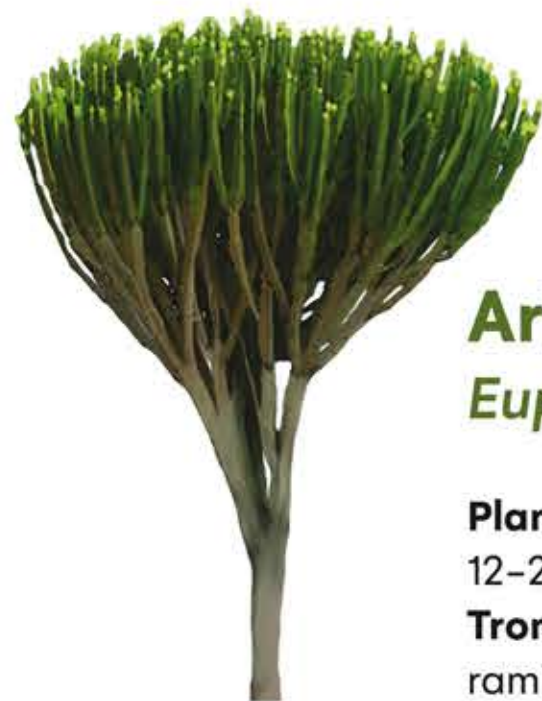
Arbre canelobre Euphorbia candelabrum

Cactus columnar. Tiges: cilíndriques erectes i primes, d'uns 2–3 m d'alt. Estan totalment coberts per espines blanques que li donen un aspecte característic. Té 5–30 costelles estretes i poc prominents. Arèoles xicotetes i molt juntes amb una llanositat blanca. Espines: aciculars, fines i denses. Flors: primavera–estiu. Allargades i lleugerament corbades, tubulars i obertes sols per l'extrem, de color carmí obscur, violeta en el punt on els pètals s'obren amb els estams roig pàl·lid que sobreixen.